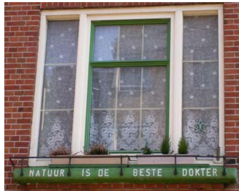
Vitamine G: Hoe meer groen in de buurt, hoe beter je je voelt.