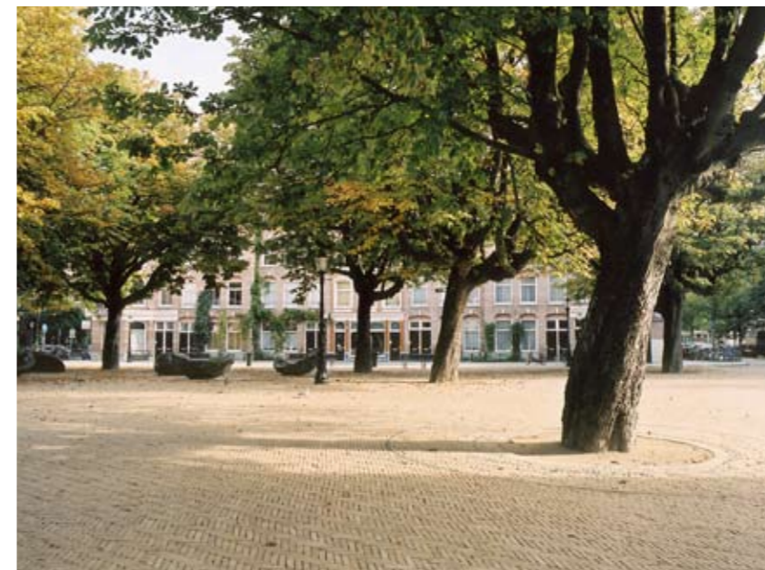
Kastanjeplein, Amsterdam ontwerp Handle With Care