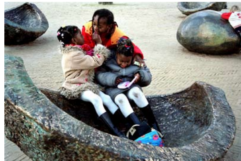
Bronzen kastanjeschil Kastanjeplein, Amsterdam ontwerp Handle With Care

Een goed voorbeeld zijn de grote, bronzen kastanjeschillen op het Amsterdamse Kastanjeplein, waar kinderen op allerlei manieren mee spelen. Een ander geslaagd project is het Avontureneiland in het Rotterdamse Zuiderpark. Soms is het mogelijk om vormen van (natuur)educatie te integreren in het ontwerp. Ontwerpen voor ontdekkend spelen zijn een manier om in de beperkte ruimte van de stad een omgeving te creëren waar kinderen zich kunnen uitleven, ontwikkelen, uitgedaagd worden en contact leren maken met elkaar en de omgeving.