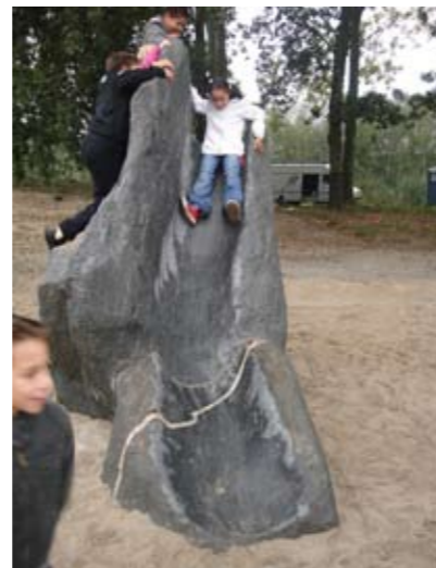
Natuurstenen glijbaan Zuiderpark, Rotterdam ontwerp Handle With Care