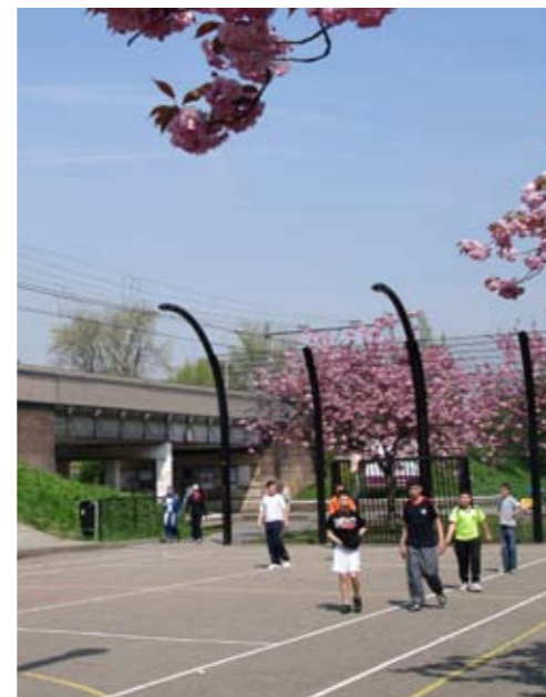
Sportplein met tribune Transvaal, Vogelaarwijk Amsterdam ontwerp Handle with Care