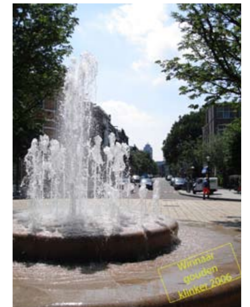
Fontein Hogeweg, Amsterdam winnaar gouden klinker 2006 ontwerp Handle with Care