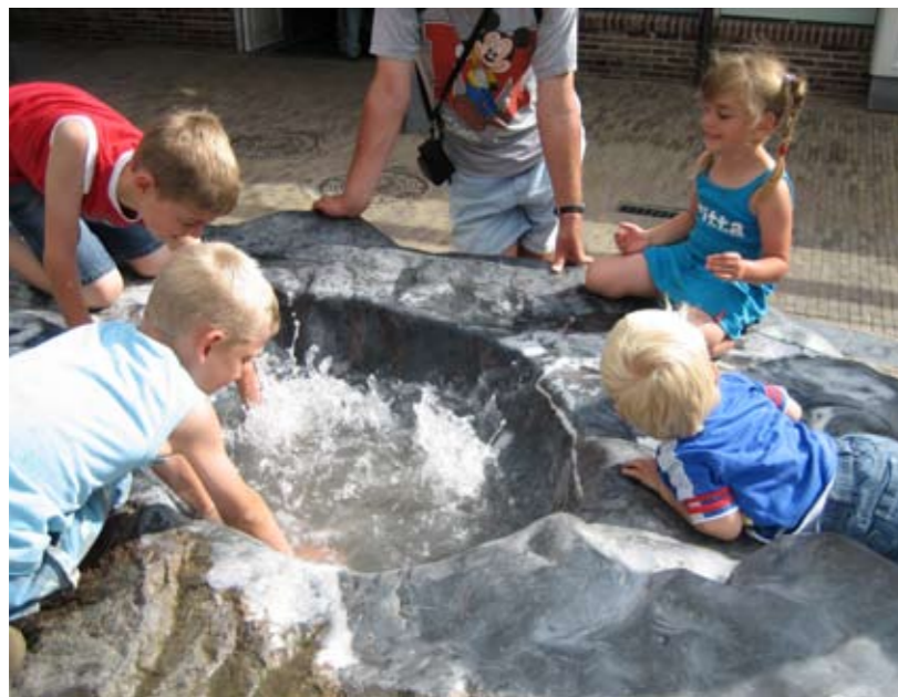
Waterbron natuursteen Bataviastad, Lelystad ontwerp Handle with Care