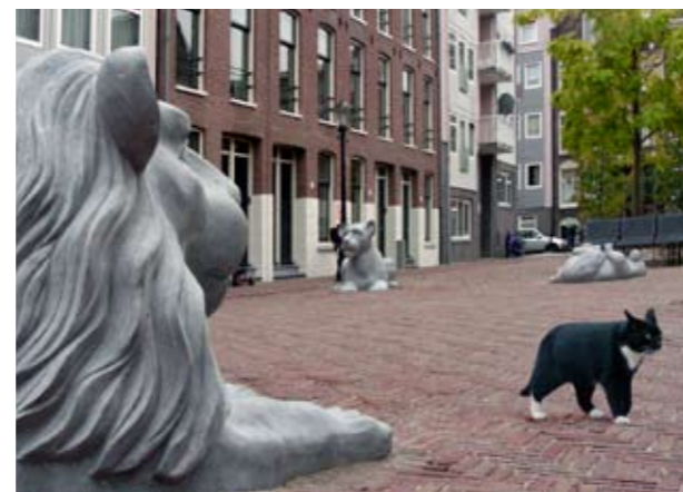
Natuurstenen dieren Leeuwenhoekstraat, Amsterdam ontwerp Handle with Care