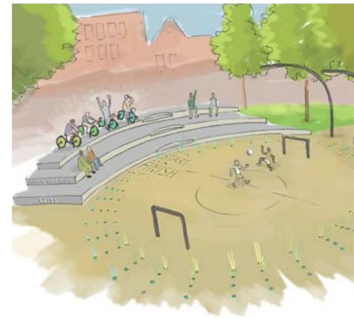
Concept Handle with Care outdoorfitness in combinatie met opwekken van duurzame energie LED verlichting

Samenvatting artikel GGD-Nederland 1 mei 2007