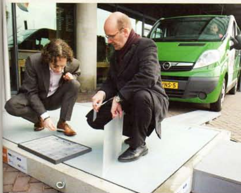
SolaRoad: de weg als zonnepaneel.

SolaRoad Opdrachtgever TNO ( www.tno.nl ); provincie Noord-Holland Ontwikkeling Ooms Avenhorn Groep ( www.ooms.nl ) en Imtech ( www.imtech.nl )