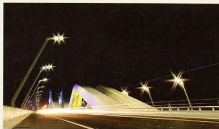
De spectaculair verlichte Sheikh Zayed-brug in Abu Dhabi.

energie vanuit de hoofdstad naar de regio. Maar het licht doet meer. Door lichtscenario's voor de brug te koppelen aan andere plekken in de stad gaat het licht op de brug relaties aan op een veel grotere schaal. Zo is een lichtplan gemaakt voor nachten met nieuwe maan, waarbij de verlichting van de brug een spel aangaat met diepblauwe verlichting van de Grand Mosque.