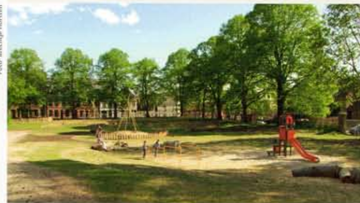
Een van de zeven reizende tuinen in Arnhem.